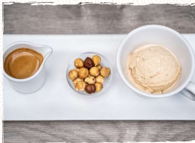
Affogato Light 11 P 900

Shot d'espresso servi avec une boule de glace noisette et notre crémino noisette, agrémenté de noisettes croquantes