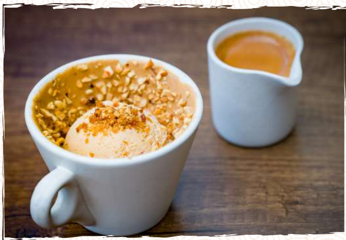
Affogato noisette bianca 11 P 900

Shot d'espresso servi avec une boule de glace noisette et notre crémino noisette, agrémenté de noisettes croquantes