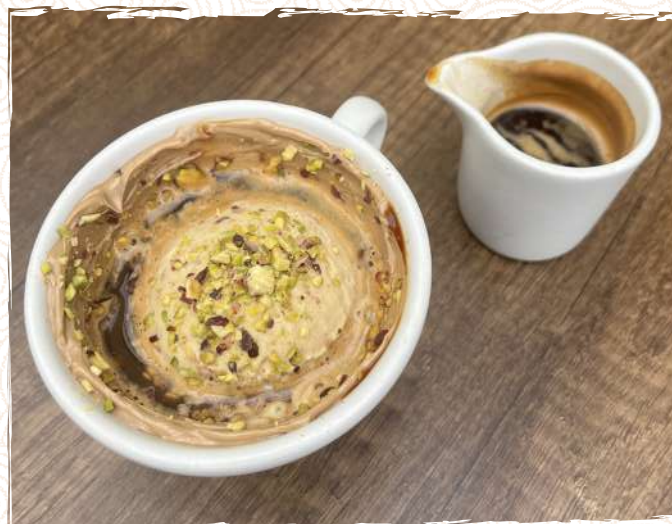
Affogato Royal 12 P 900

Un shot d'espresso avec une boule de noisette, des éclats de noisette torrifiées et caramélisées et notre Cremino chocolat noisette