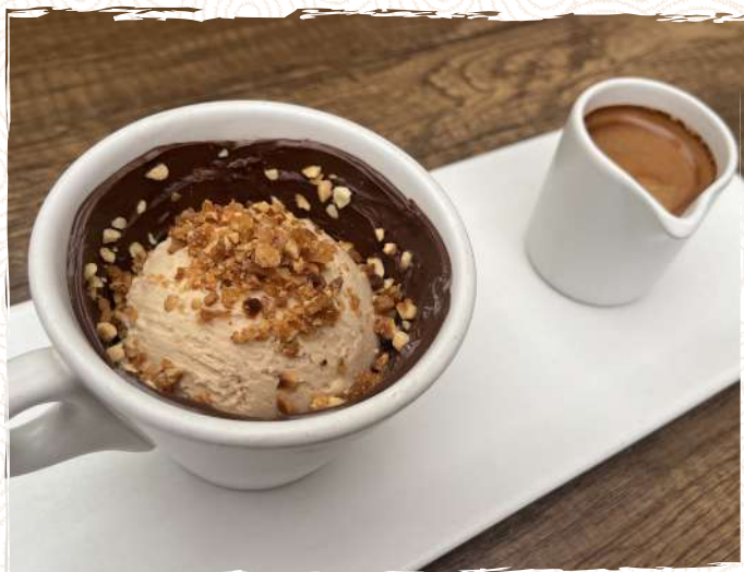
Affogato Chocolat noisette 11 P 900

Un shot d'espresso avec une boule de noisette light, accompagné de noisettes entières torrifiées